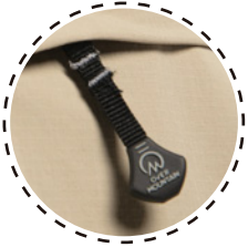
TIRADOR CON MARCA OVER MOUNTAIN