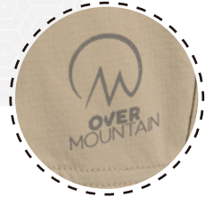
MARCA EN TRANSFER REFLECTIVO

El nuevo PANTALÓN MOLLEN se opone al pensamiento convencional para ofrecer un rendimiento, comodidad y estilo superior.