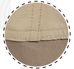
RODILLAS CON ELASTICIDAD 360