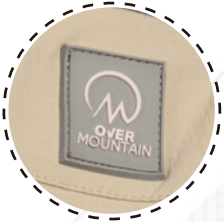
LOGO DE MARCA ENGOMADO