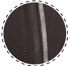
BOLSILLO CON PRINT REFLECTIVO