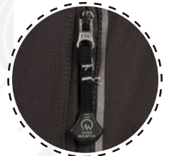
TIRADOR CON MARCA OVER MOUNTAIN