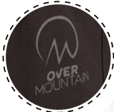
MARCA EN TRANSFER REFLECTIVO