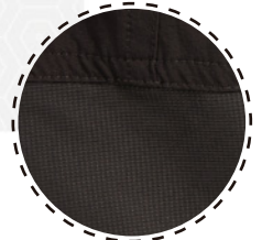
RODILLAS CON ELASTICIDAD 360

El nuevo PANTALÓN MOLLEN se opone al pensamiento convencional para ofrecer un rendimiento, comodidad y estilo superior.