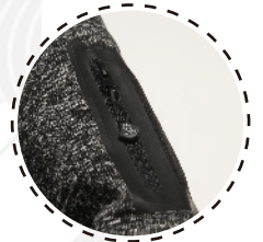
BOLSILLO CON CIERRE EN MANGA

CHAQUETA KNIT FLEECE (tejido exterior melange interior fleece) actúa como segunda capa siendo una prenda liviana y confortable.