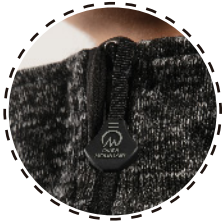
TIRADOR CON MARCA OVER MOUNTAIN