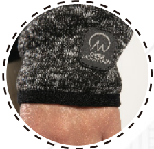
TERMINACIÓN EN MANGA CON VIVO